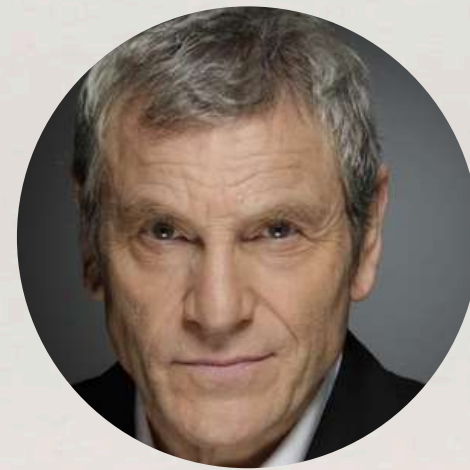
Tchéky Kario Acteur