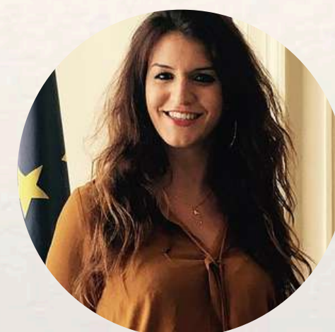
Marlène Schiappa Ancienne Ministre